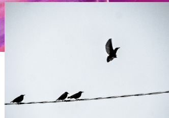
Bedrifts- og organisasjonsutvikling