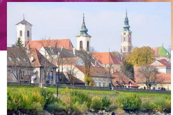
Kurs, foredrag og workshops